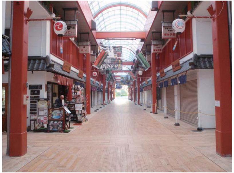
浅草西参道商店街（東京）特殊サイズ