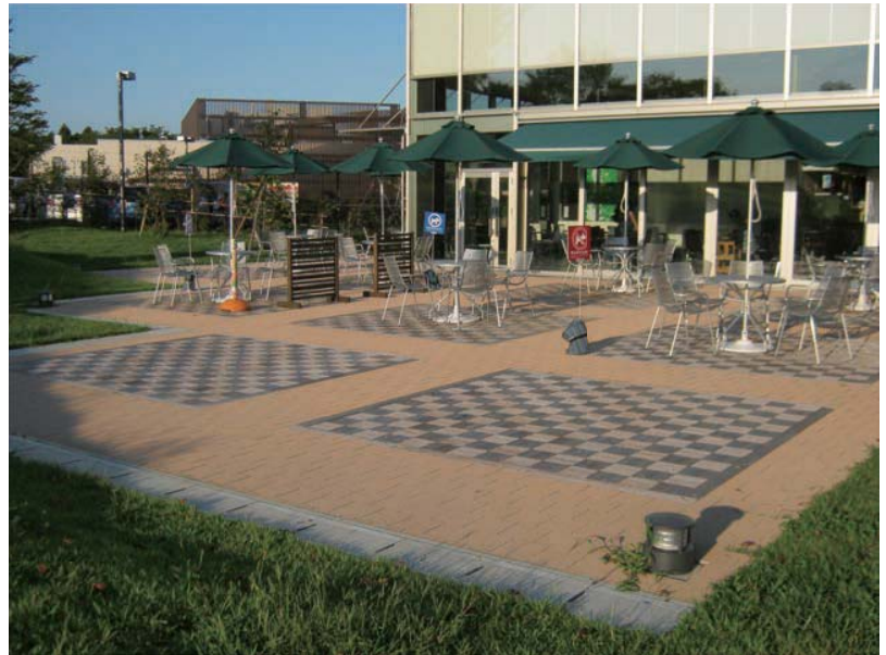
東名高速道路足柄SA（静岡）