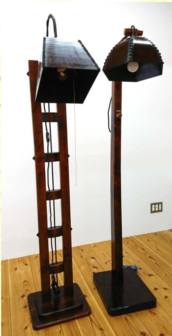
四角タイプ 六角タイプ