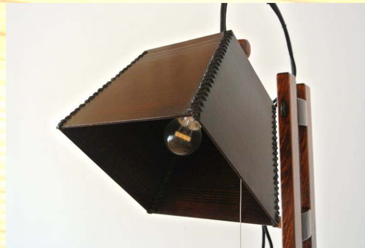
シェード(板材+紐組み)