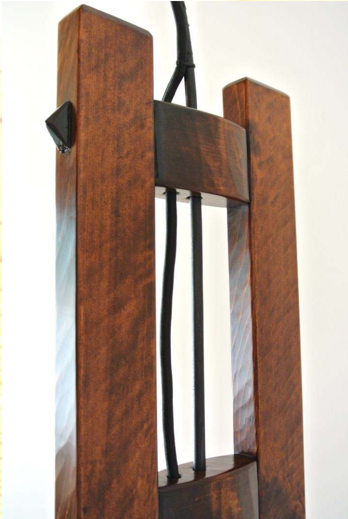
支柱の質感(ノミ掘り拭き漆)