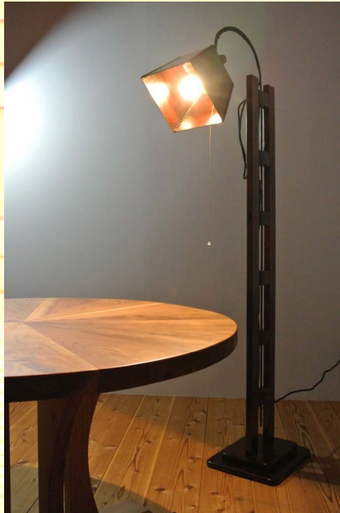
四角タイプ(照明暖色系)