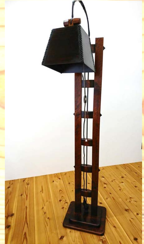
昼間はインテリア