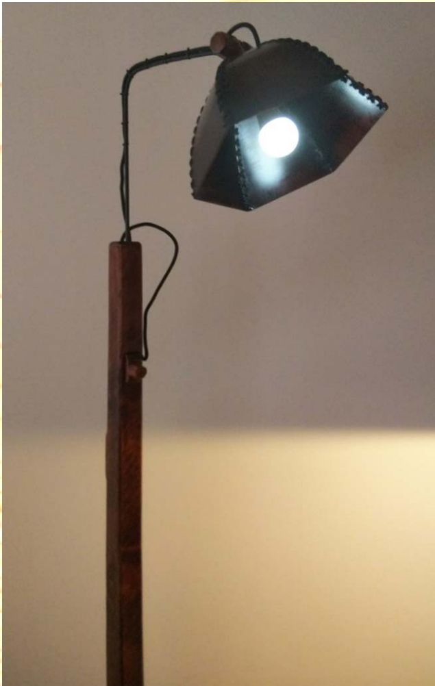
六角タイプ(照明白色系)