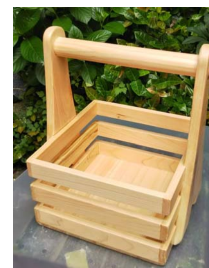
シンプル形状の廉価版